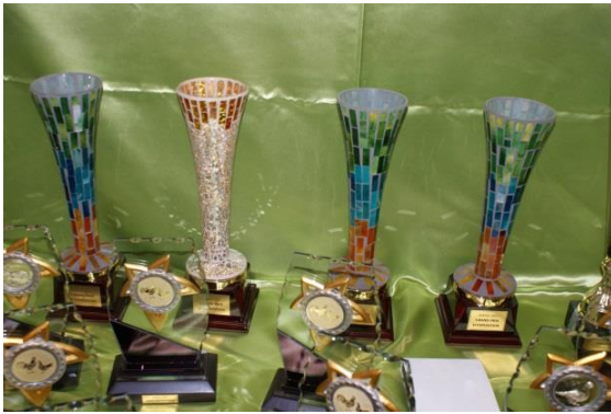
Une partie des récompenses de l'Internationale 2017 (2700 cages)