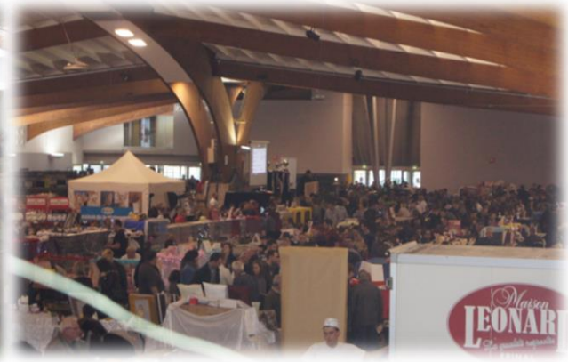
Vue de la restauration et du Championnat du Monde des Chats en 2014