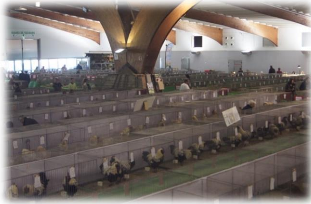
Vue du Championnat de France 2014 du Houdan, Faverolles Club