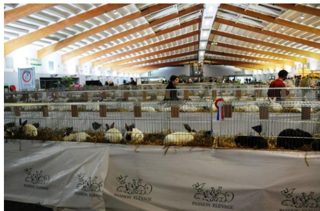
La moitié environ de la grande halle (5500m 2 ) en 2012